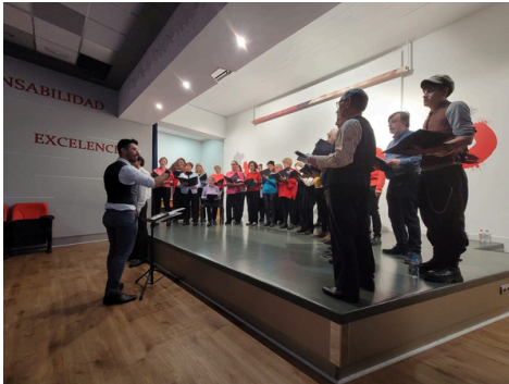
Actuación coro 'Voces del Barrio'

Unos días después, las especiales y generosas voces de los integrantes del coro 'Voces del Barrio' pusieron el broche final a los festejos navideños y nos impulsaron a iniciar de la mejor forma posible este 2025.