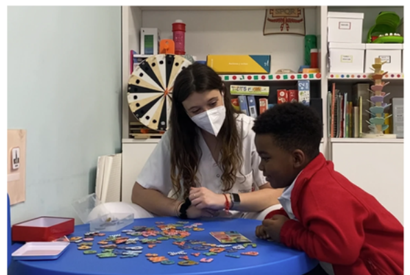
Foto: de 8 años recibe sesiones de logopedia, psicomotricidad y terapia ocupacional desde que nació en el FUNDACIÓN SAN JUAN DE DIOS

La intervención terapéutica entre los 0 y 6 años marca la diferencia en la evolución de los menores con discapacidad intelectual o del desarrollo que la reciben, optimizando sus habilidades y competencias en la adolescencia y la edad adulta