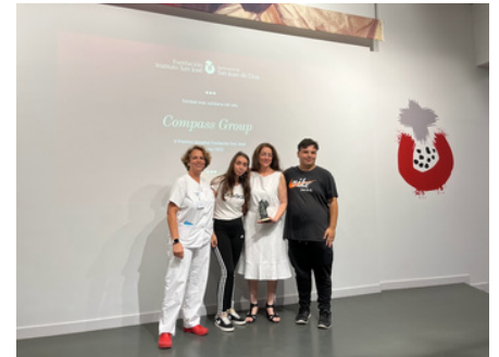
Compass Group, premio a la entidad más solidaria