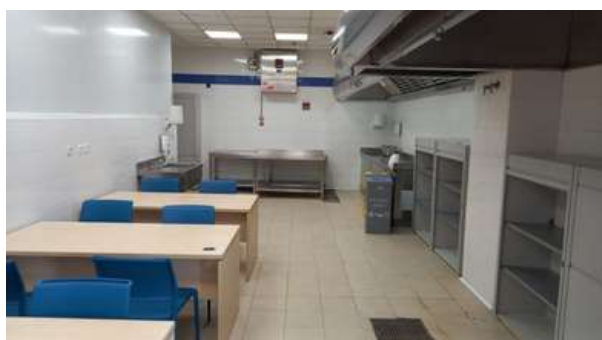
Aula del nuevo ciclo de Cocina

A su vez, el Colegio de Educación Especial se ha pintado y actualmente se está llevando a cabo el rediseño del patio como parte de las mejoras programadas para el tercer trimestre del año.