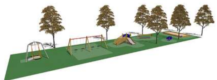
Diseño del patio del Colegio